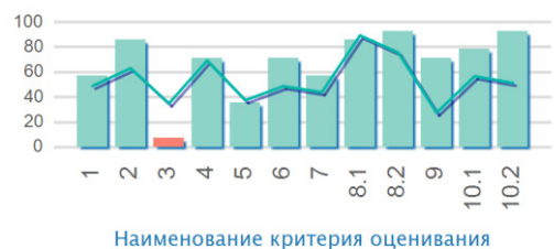
Математика - 5 класс