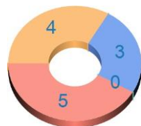
Русский язык - 8 класс