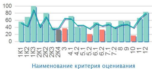
Русский язык - 5 класс