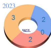
Русский язык - 7 класс